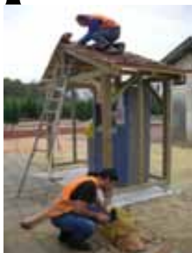
Un exemple de réalisation par La Main forte : la construction d'un abri pour le distributeur de billets à la gare SNCF de Sarlat

L'ouverture prévue en octobre 2012 d'un centre de formation près du lycée à Sarlat s'accompagne d'une montée en charge des actions en faveur de la qualification professionnelle des salariés du BTP. Une enquête dans 70 entreprises a fait émerger des besoins en maçonnerie et de spécialisation en taille de pierre. Deux projets soutenus par la Maison de l'emploi vont y répondre : le CFA BTP ouvrira à la rentrée 2012 une section d'apprentissage « maçon du bâti ancien » avec une formation technique sur 1 an conduisant à un titre