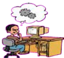
Salarié (ou fonctionnaire)