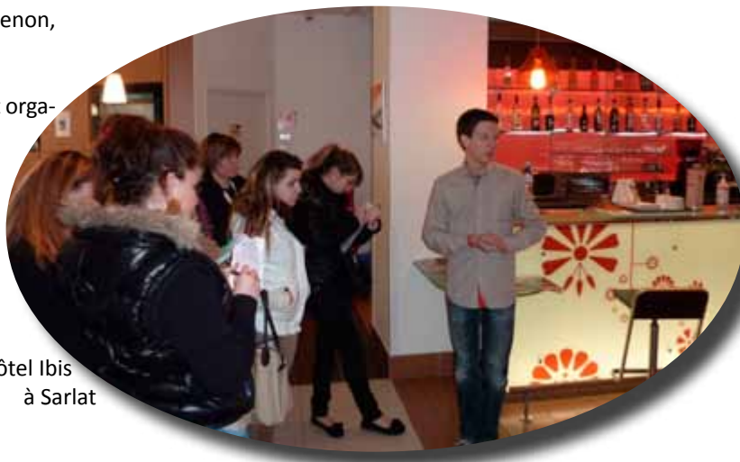
Visite de l'hôtel Ibis à Sarlat

Les Lycées, la MFR, la plateforme de formation ont organisé des portes ouvertes