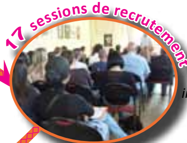
17 sessions de recrutement

information collective puis entretiens individuels