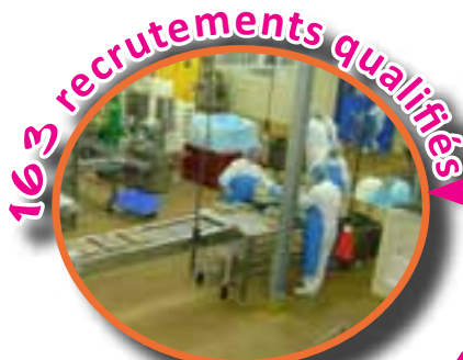
163 recrutements qualifiés

information collective puis entretiens individuels