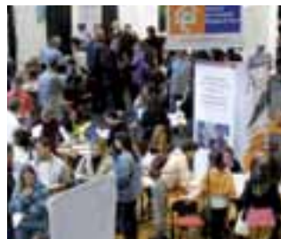
forum semestriel : «Les chemins