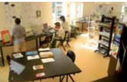
libre accès à internet et à la documentation