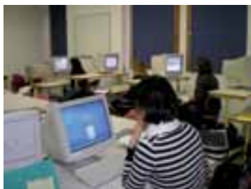
salle informatique 10 postes fixes connexion wifi - visioconférence