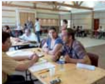
forum trimestriel création / reprise d'entreprise