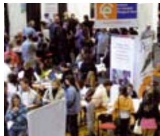
forum semestriel : «Les chemins