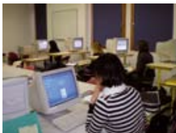
salle informatique 10 postes fixes connexion wifi - visioconférence