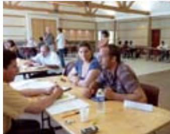
forum trimestriel création / reprise d'entreprise