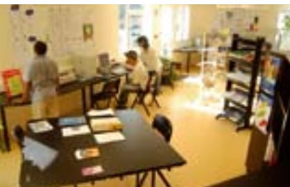
libre accès à internet et à la documentation