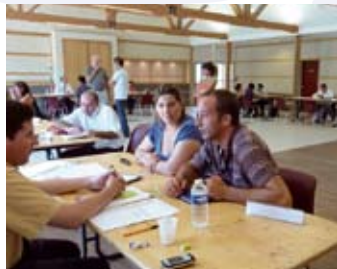
forum trimestriel création / reprise d'entreprise