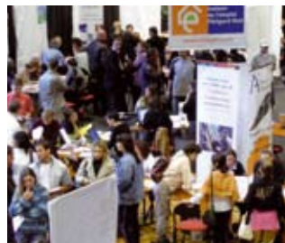
forum semestriel : «Les chemins