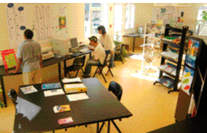
libre accès à internet et à la documentation