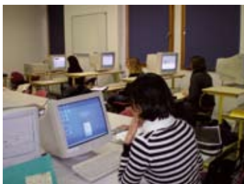
salle informatique 10 postes fixes connexion wifi - visioconférence