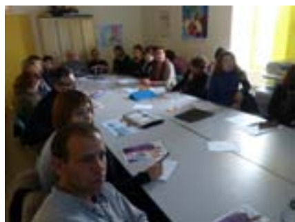
=> Une réunion d'information à Belvès suivie par 20 personnes