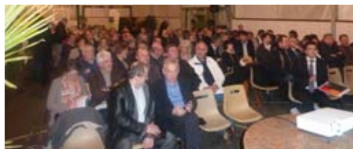
Assemblée Générale de l' AIS le lundi 03 décembre 2012