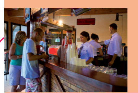
Hôtels, Cafés, Restaurants, Hôtellerie de Plein Air