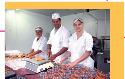
Industrie Agro Alimentaire