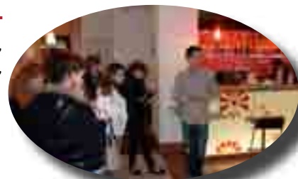
Visite de l'hôtel Ibis à Sarlat

Les Lycées, la MFR, la plateforme de formation ont organisé des portes ouvertes