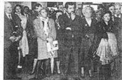
Beaucoup de monde à l'inauguration et pour écouter les