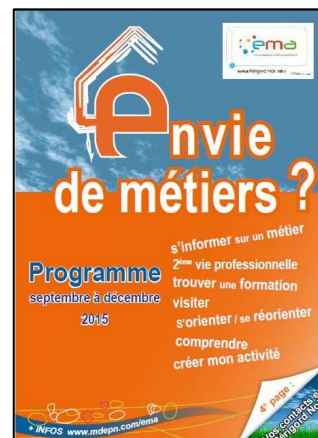
Dépliants semestriels des animations de l'EMA du Périgord Noir