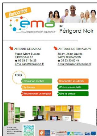
Dépliant sur l'offre de l'EMA Périgord Noir (imprimé à la demande)