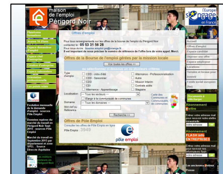
Site internet de la MDE : 4900 connexions en moyenne chaque mois