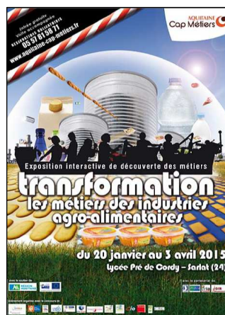
Exposition sur les métiers de l'industrie agroalimentaire Janvier à avril 2015