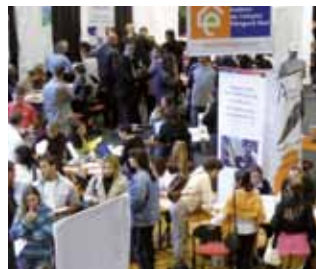
forum semestriel : «Les chemins