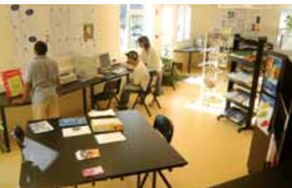
libre accès à internet et à la documentation