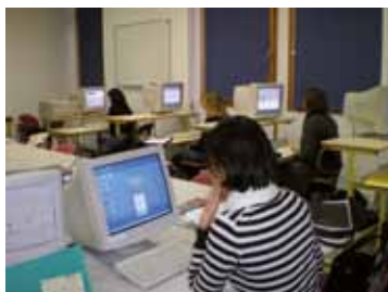
salle informatique 10 postes fixes connexion wifi - visioconférence