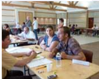
forum trimestriel création / reprise d'entreprise