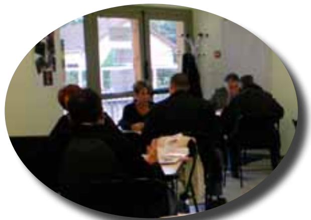
Action création d'entreprise organisée à Salignac