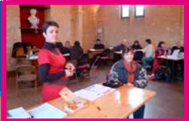
1/2 journée création d'entreprise à Belvès