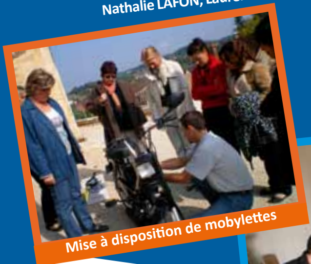
Mise à disposition de mobylettes