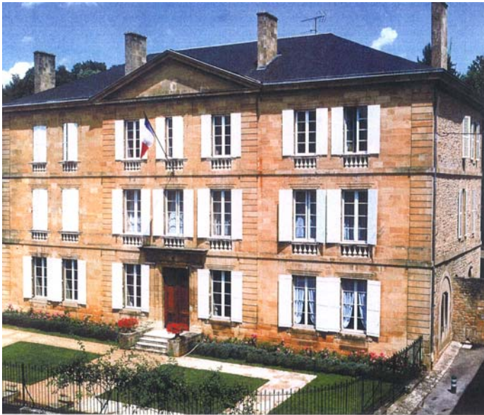
L'ancien couvent de Notre-Dame, actuelle sous-préfecture.

De l'administration des âmes à l'administration publique