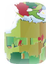
TABLE RONDE LES ENJEUX DES POLITIQUES EUROPEENNES D'INCLUSION ET D'EMPLOI